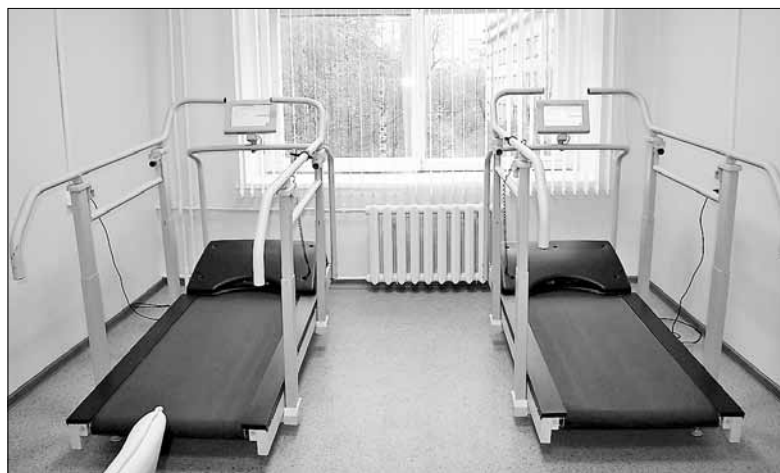
■ В реабилитационном отделении, открытом в 2018 году в 7-й городской больнице Архангельска.

Как сообщил министр здравоохранения Архангельской области Антон Карпунов, объемы прове-