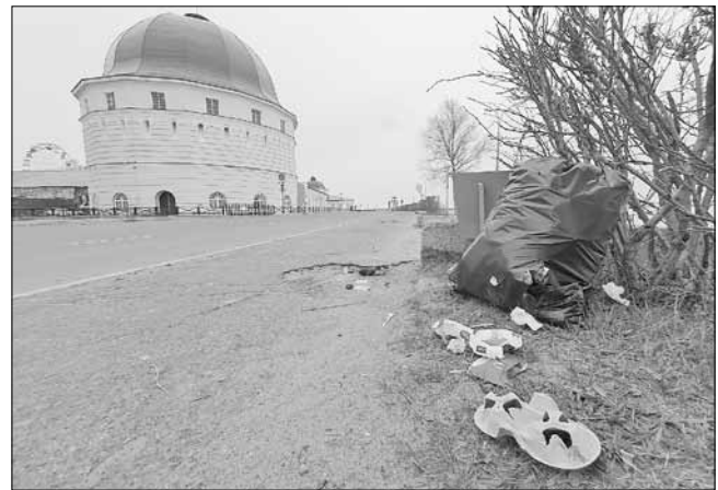
■ Черные мешки на набережной