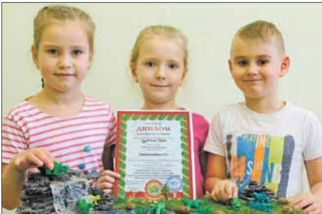
■ Воспитанники детсада постоянно участвуют в конкурсах