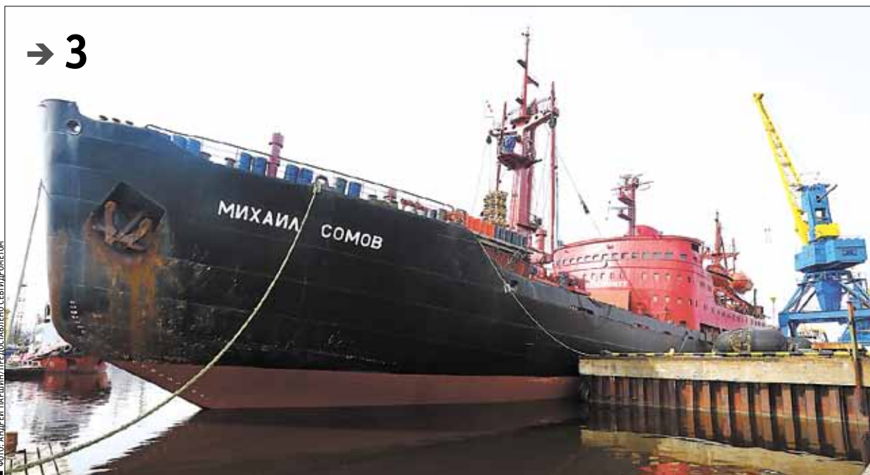
ФОТО: АНДРЕЙ ПАРИНИН/ЛЕТЕ ПРОВОДИТЕЛЕМ СЕВЕРНОГО МОРЕПРОМЕТА