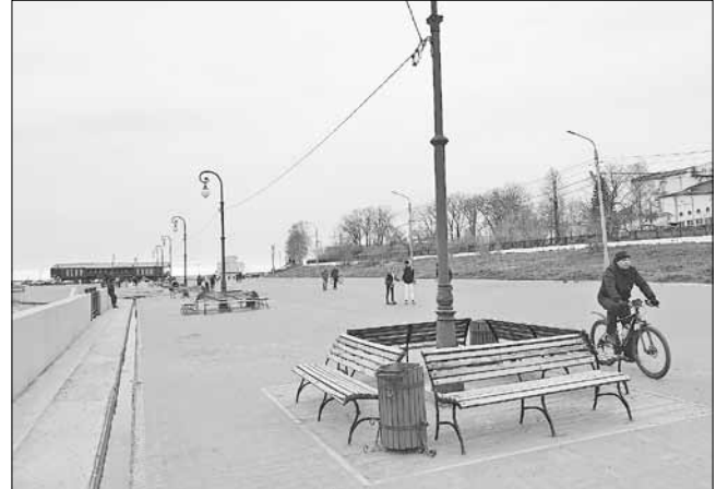
■ Та же пристань в районе драмтеатра

В общем, и главам округов вместе с подрядчиками, и торговым точкам, и организациям нужно как-то повнимательнее относиться к подведомственным им территориям. Хочется, чтобы в Архангельске было чисто и чтобы весенняя травка радовала горожан, а не служила маскировкой для неубранного мусора.