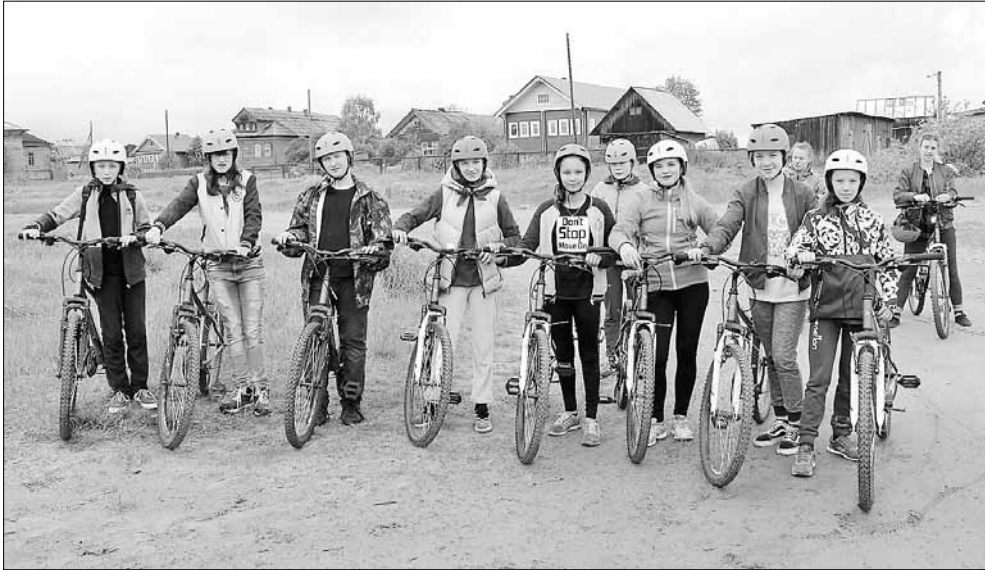
■ Смены в лагере «Северный Артек» всегда проходят насыщенно

организаторы детского отдыха должны быть готовы начать работу