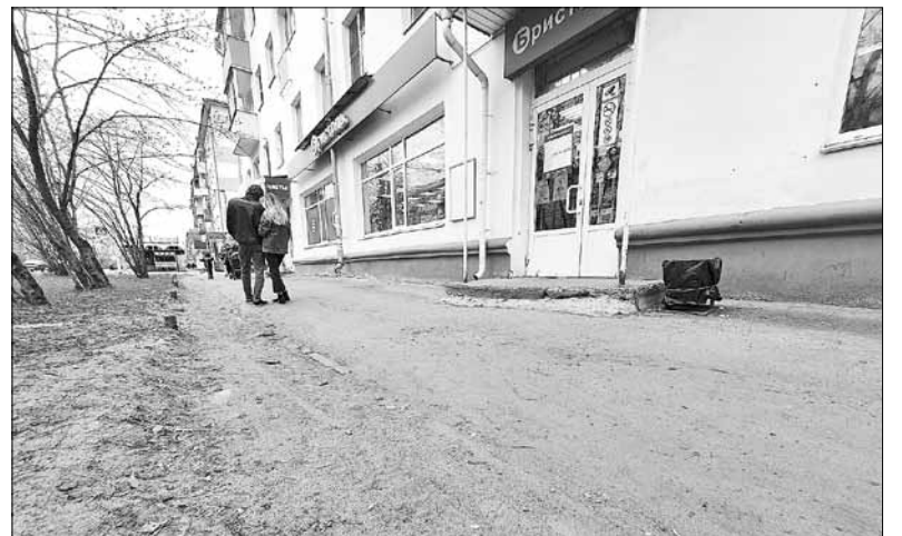
■ Изобилие песка на тротуаре на Воскресенской