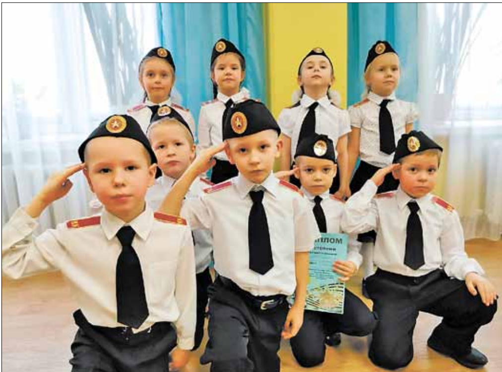
■ В детском саду есть кадетская группа

Детский сад № 6 является опорным в системе образования города Архангельска по реализации проекта «Современные подходы к вопросу взаимодействия с родителями по нравственно-патриотическому воспитанию на основе культурно-исторического наследия Русского Севера». В настоящее время взаимодействие с семьями воспитанников – одно из приоритетных направлений в образовательном процессе. Еще советский педагог-новатор Василий Сухомлинский говорил, что задачи воспитания и развития могут быть успешно решены только в том случае, если детский сад будет поддерживать связь с семьей и вовлекать ее в свою работу. Используя многолетний опыт работы, педагоги «Олененка» активно применяют различные современные формы, методы и приемы взаимодействия с родителями воспи-