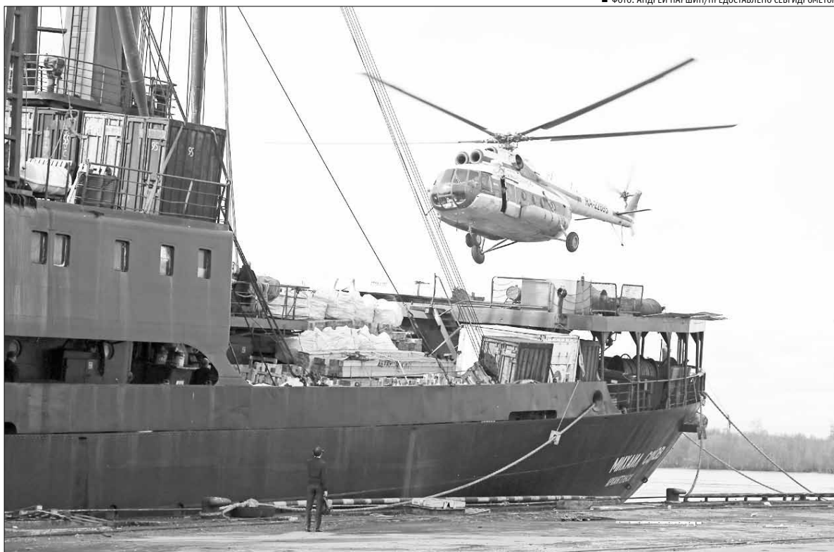
■ Вертолет Второго авиаотряда приземляется на палубу судна, чтобы отправиться вместе с ним в экспедицию

Льдов вообще стараются избегать, хотя бы потому, что далеко не все работы по разгрузке-погрузке можно выполнять в таких условиях, вместе с тем судно теряет в скорости и растут расходы. Сами льды «Михаилу Сомову» не страшны, это судно с хорошей ледостой-