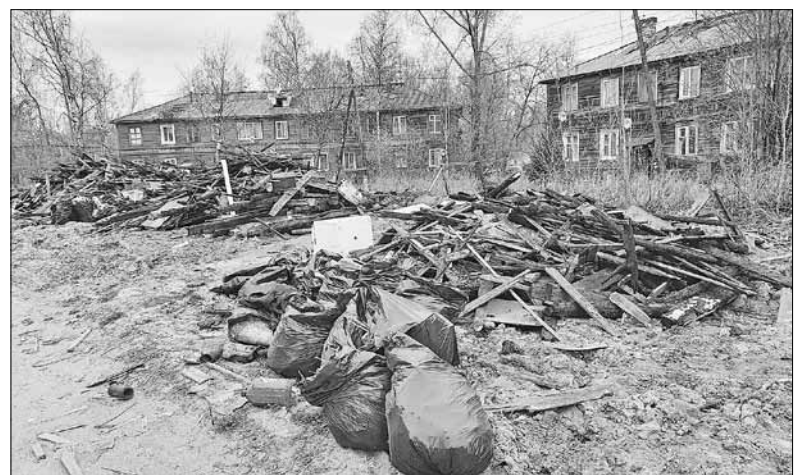
■ Пейзаж на Суфтина, 19