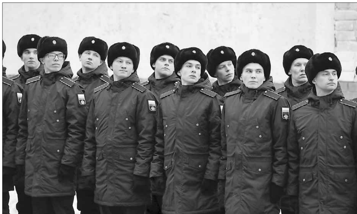
■ Фото с призывной кампании 2019 года. Сейчас отправка новобранцев в армию проходит с учетом мер безопасности – без лишних гостей, с соблюдением социальной дистанции и обязательно в масках

Работа ведется с учетом новых требований размещения на призывном пункте. Процесс органи-