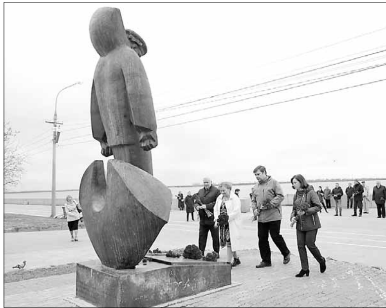
■ Возложение цветов к памятнику Соловецким юнкам.

– Все, что связано с Великой Отечественной войной, носит для нашей страны священный характер. Архангельск всегда считался городом моряков и рыбаков, находил-