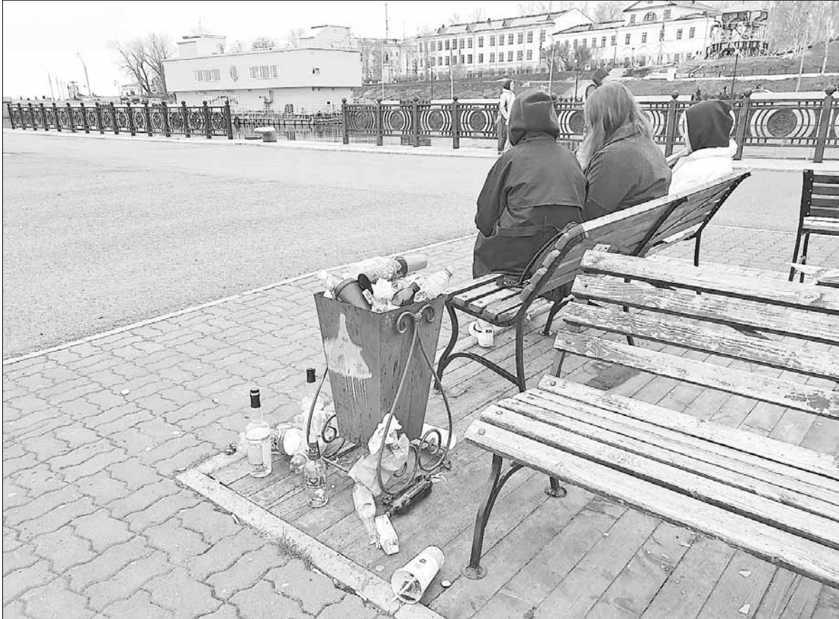
■ Так выглядит Красная пристань напротив беседки Грина

Прогулочную зону на набережной не успевают вовремя убирать