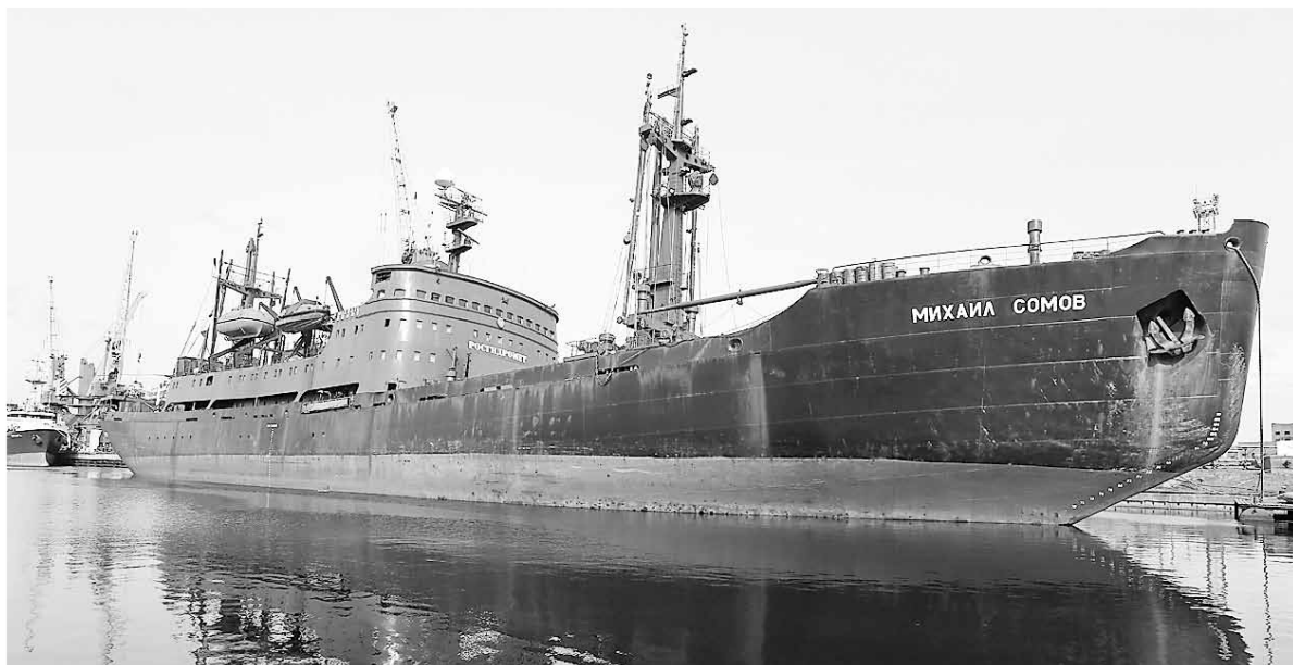
■ Трудяга «Михаил Сомов» – уникальное судно