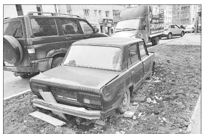
■ Брошенные «Жигули» как арт-объект на Новгородском