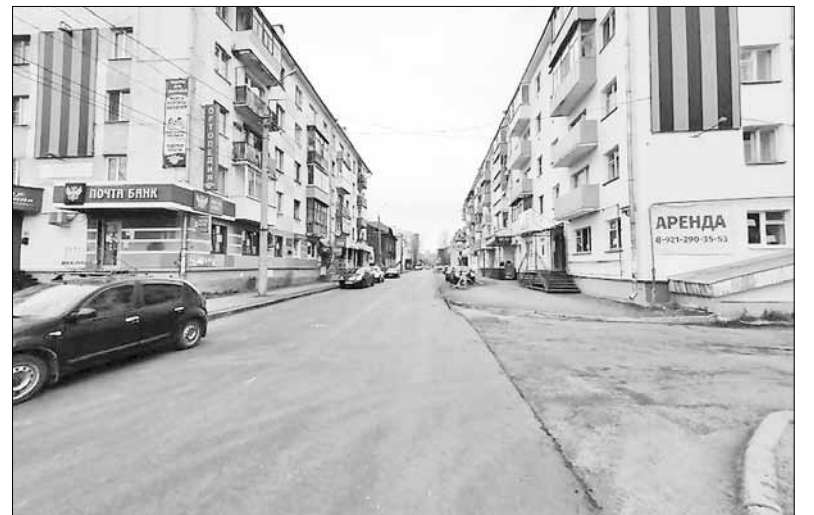
■ Новый асфальт на улице Володарского.

– ул. Учительская от ул. Шабалина до ул. Урицкого. Завершено фре-